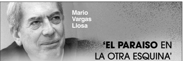
Mario Vargas Llosa