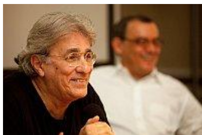
Abilio Estévez

Uno de los escritores cubanos más premiados e internacionales de la actualidad, el novelista, cuentista, poeta y dramaturgo Abilio Estévez, cuyas obras han sido ya traducidas a una decena de lenguas, fue uno de los invitados principales del congreso sobre Latinoamérica que albergó la Universidad Palacký de Olomouc el pasado fin de semana.